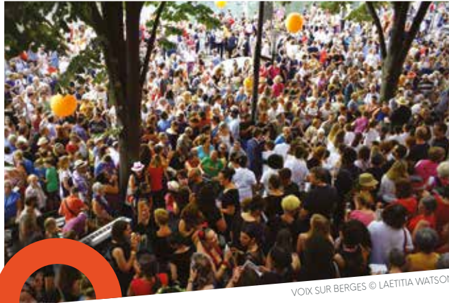
VOIX SUR BERGES