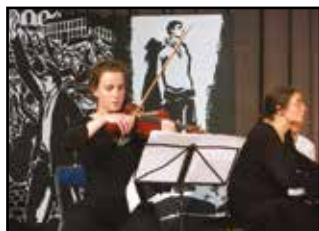
UNIS-SONS © CRL10