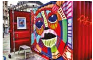
LUDOMOUV' CITOYENNE

Pour toutes ces actions, informations ► myriam.bouazzouni@crl10.net