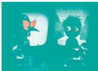
MANGE TES RONCES! © ALEXANDER MEEUS