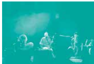
VIOLONS BARBARES

jazz de haut vol, des concerts et tremplins pour les jeunes, des spectacles et concerts en famille, artistes professionnels et amateurs éclairés, ouvertes aux créations des élèves avec l'aide attentive de leurs animateurs, soirées conviviales, rendez-vous de découverte ou de réflexion, rendez-vous artistiques auxquels on peut joindre ceux des expositions Escalé à la Grange-aux-