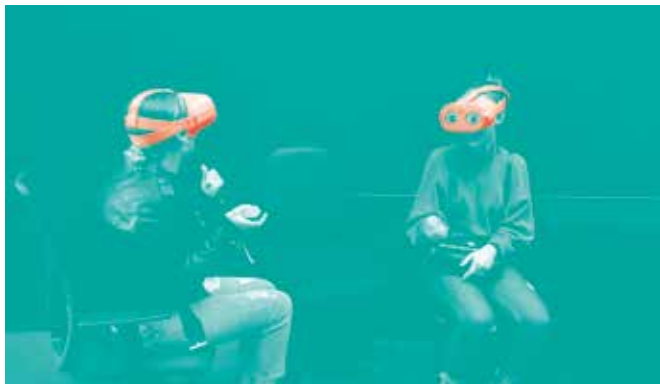
LA RENTRÉE NUMÉRIQUE

Des échanges culturels interdisciplinaires pour et par les jeunes de différents pays européens, des projets créatifs autour de la citoyenneté, des discriminations ou de lutte contre le racisme.