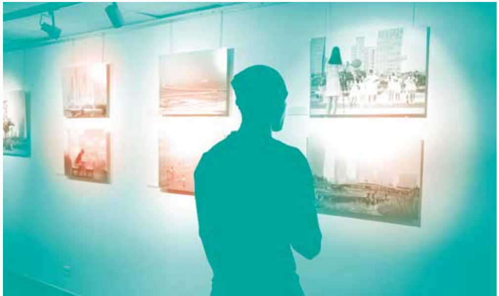
ESCALE À LA GRANGE-AUX-BELLES

Un festival de courts métrages, où amateurs et futurs pros font se côtoyer leurs œuvres. Les bénévoles du Conseil de Maison anime ce festival, en accueillant et dirigeant le public et en tenant la restauration.