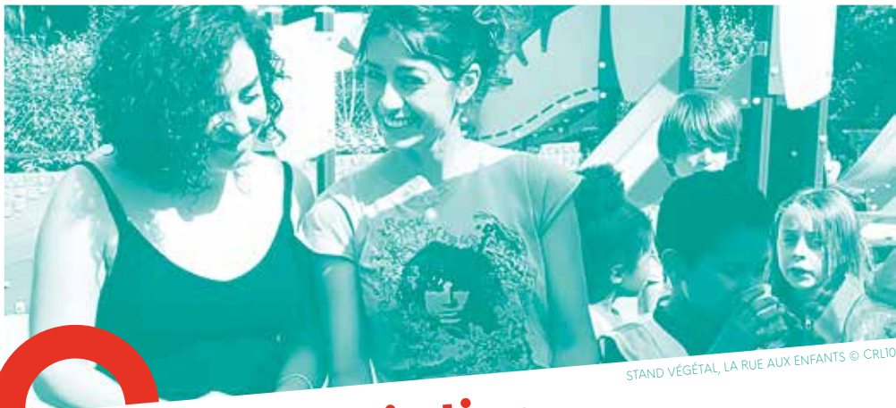
STAND VÉGÉTAL, LA RUE AUX ENFANTS