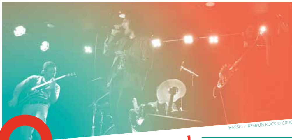
HARSH - TREMPLIN ROCK