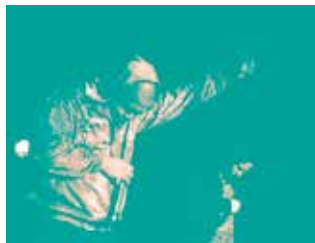
NUMA - TREMPLIN ROCK

Les trois tremplins musicaux du CRL10, ouverts à tous les jeunes musiciens, devant un jury professionnel. À la clef: trois journées d'enregistrement en studio professionnel, du matériel musical, des créneaux de répétition et un concert « Carte Blanche » à l'Espace Jemmapes.