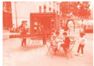
LUDOMOUV' CITOYENNE

En partenariat avec la Direction Familles et Petite enfance (DFPE) de la Ville de Paris.