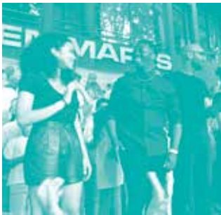
VOIX SUR BERGES

Cartes blanches aux ateliers musique et théâtre, aux artistes en résidence, aux musiciens du quartier ou de passage... L'équipe du centre vous accueille et vous accompagne dans votre proposition artistique.