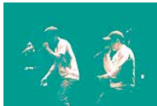
DIXIÈME CHAMBRE

Des concerts dans tous les styles des musiques actuelles à la Scène du Canal (une fois par mois), des sessions d'enregistrement et des créneaux de répétition dans les centres Paris Anim' Château-Landon et Jemmapes, tous les samedis, des ateliers d'écriture pendant les vacances.